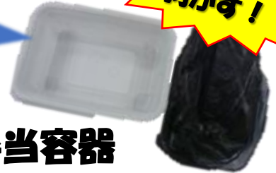
生協手作り弁当容器 (リ・リパック)のフィルム