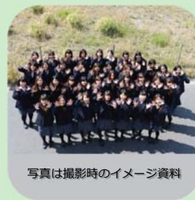
写真は撮影時のイメージ資料

出演した学生には“MIEUポイント”1,500点を付与します。 8月17日(月)の事前説明会は、8月19日(水)の撮影当日に参加する服装で来てください。 ご応募の際、ご記入頂きました個人情報は、本エキストラ募集を目的とし第三者に開示・提供することはありません