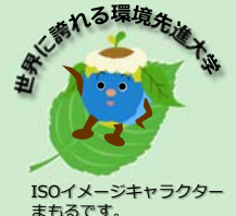
ISOイメージキャラクター まもります。