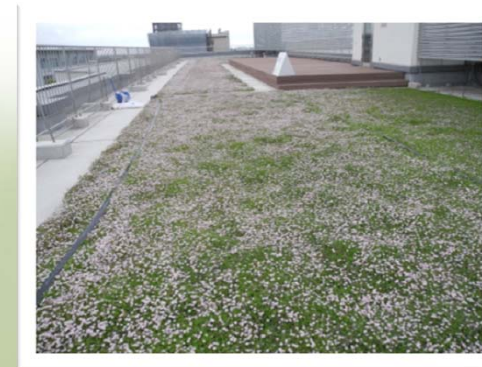
たくさん咲きました。