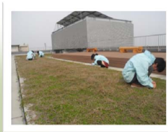
草抜きをしました。